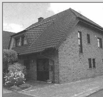
Apartment 63 Ferienwohnung

Grüne-Jäger-Str.78 | 47574 Goch tel 02827 5928 | mobil 0171 2258239