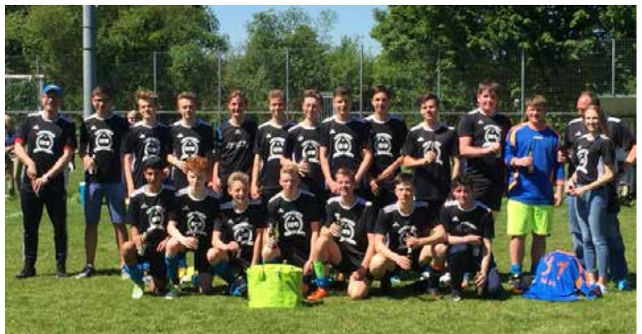
(Mit einem klaren 6:0 Sieg, wurde vorerst die Meisterschaft gebührend gefeiert, welche aber erst am letzten Spieltag mit der großen Party besiegelt wird.)

Die Jungs bedankten sich, fast wie die Profis der großen Vereine mit einer La Ola Welle und der dazugehörigen Sektdusche bzw. Bierdusche bei den vielen mitgereisten Fans.